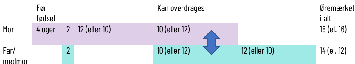
Figur 3. Ny barselsmodel - som i de andre nordiske lande

En sådan "nordisk" model er skitseret i figur 3.