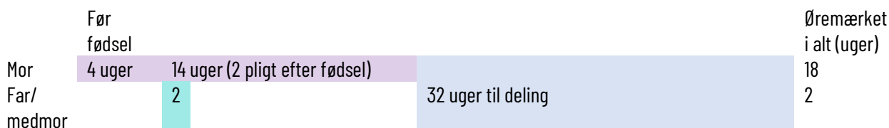
Figur 1. Nuværende danske barselsmodel (barselsdagpenge)

I figur 1 er skitseret den nuværende model for betalt barsel og forældreorlov dvs. de uger, hvor man kan få udbetalt barselsdagpenge. Den betalte orlov udgør i alt 52 uger. Derudover har man som forælder ret til fravær i længere tid.